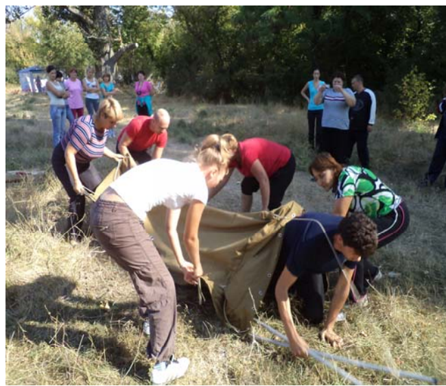
Команда Нижегородского УВК «Школа-гимназия» №3

Не менее интересно проходят и традиционные туристические слеты работников образования на поляне села Лиственное Нижегородского района. Соревнования длятся два дня. В первый день проводятся приветствие команд, конкурс оригинальных блюд, вечером у костра конкурс